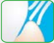
毛先の丸い歯ブラシ