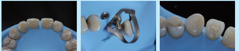
【Nic Tone ラバーダム ラテックスシート ブラック使用例】