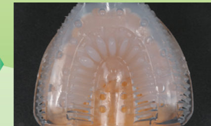
硬化するまで保持します。