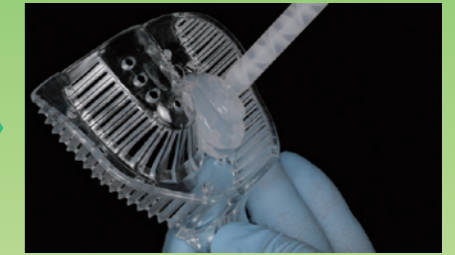
既製透明トレーもしくは個人トレーにクリアマトリックスを注入します。