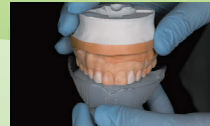
クリアマトリックスを注入した既製透明トレーに診断用模型を正確に適合させます。