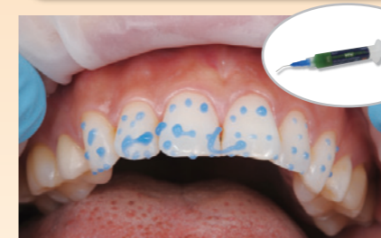
暫間期間に応じて、スポットエッチングします。