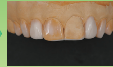
診断用ワックスアップ模型を作成します。