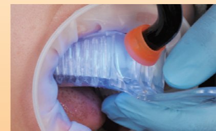
リベールを注入した既製トレーを口腔内の正確な位置に適用し、リベールを各歯面あたり各20秒間光照射します。