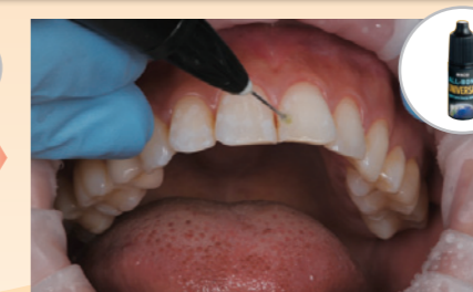
接着部位以外および歯肉縁等に分離材を適用します。接着部位に接着材の製造業者の指示に従って、接着処理を行います。