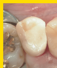
仮封後(ガラスアイ オノマーセメント)。