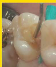
セラカルLC シリンジチップによる 覆髄。