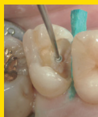
ライナーアプリーケーターによる覆髄。 適量のセラカルLCで的確なスポット覆髄が可能。