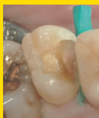
う蝕除去後。 不顕性露髄。