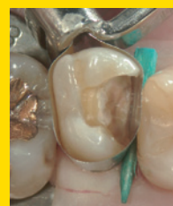
覆髄後。 マトリックス装着。