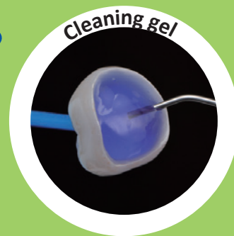
Cleaning gel 5%未満水酸化カリウム溶液