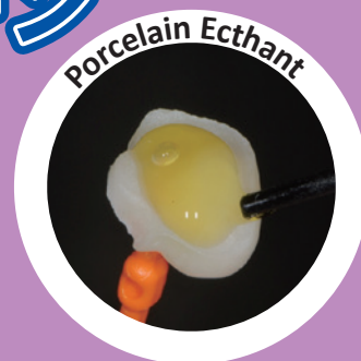
9.5%フッ化水素酸 医薬用外毒物