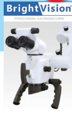
使用マイクロスコープ ブライトビジョン LED 5000 ベントロン ジャパン 株式会社