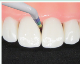
バイオクリアー ブラック トライアングルゲージを挿 入