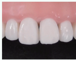
コンポジットレジン修復後