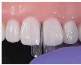
バイオクリアー マトリッ クス歯間離開用を装着