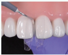
フロアブルレジンを充填