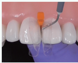
ダイヤモンドウェッジを装 着し、反対側にフロアブル レジンを充填