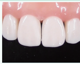
コンポジットレジン修復後