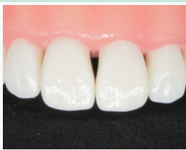
ブラケットライアングル 模型歯