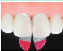
バイオクリアー ブラック トライアングルマトリッ スを装着