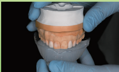
リビールクリアマトリックスを注入した既製透明トレーに診断用模型を正確に適合させます。