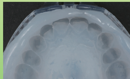
リビールクリアマトリックスによる印象面。余剰クリアマトリックスをトリムし除去します。