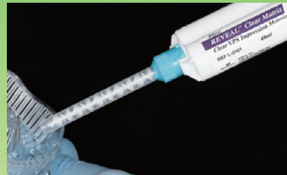
既製透明トレーもしくは個人トレーにリビールクリアマトリックスを注入します。