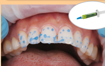
暫間期間に応じて、スポットエッチングします。