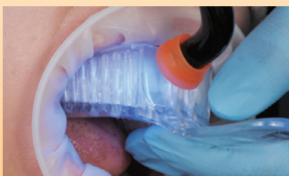
リビールを注入した既製トレーを口腔内の正確な位置に適用し、リビールを各歯面あたり各20秒間光照射します。