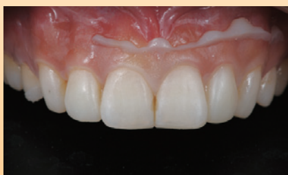
既製トレー撤去後。形態修正および研磨します。