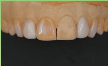
診断用ワックスアップ模型を作成します。