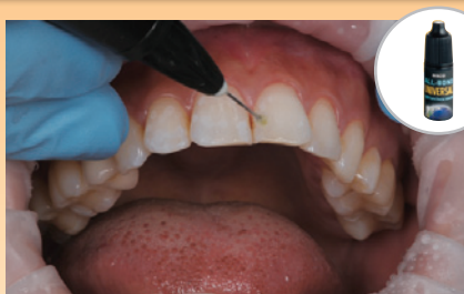
接着部位以外および歯肉縁等に分離材を適用します。接着部位に接着材の製造業者の指示に従って、接着処理を行います。