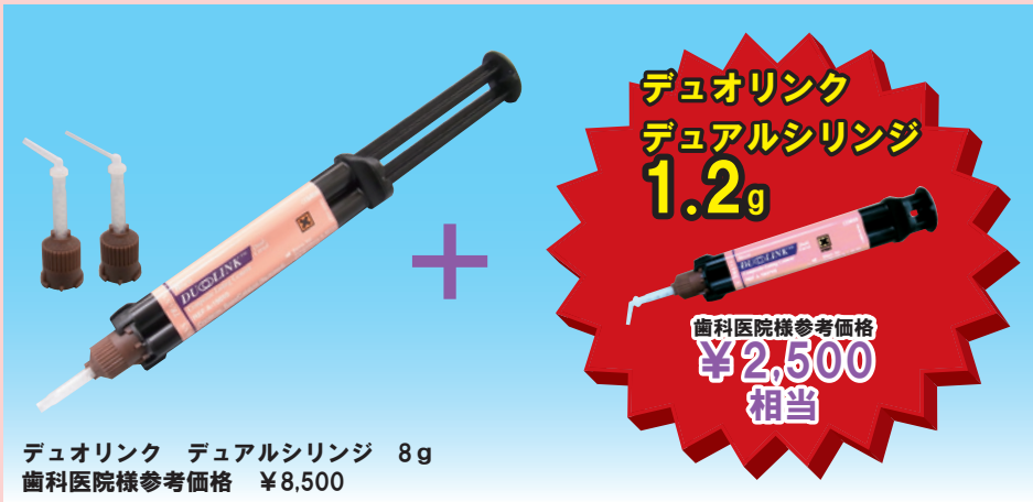
デュオリंक デュアルシリンジ 8g 歯科医院様参考価格 ¥8,500