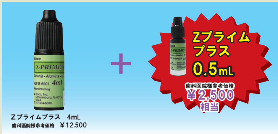
Zプライムプラス 4mL 歯科医院様参考価格 ¥12,500